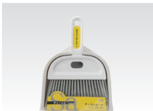
67070 サッ!とる2 テーブルホーキ