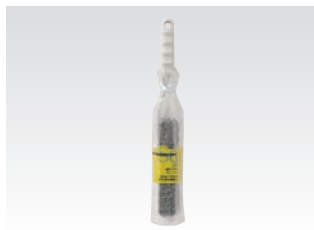
67077 サッ!とる2 網戸ブラシ