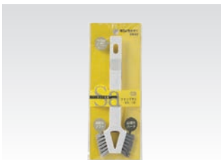
67075 サッ!とる2 ツインブラシ