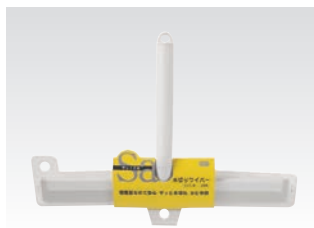
67081 サッ!とる2 水切りワイパー