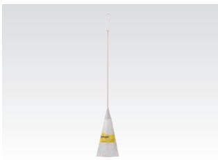
67080 サッ!とる2 ハタキ