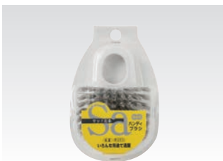
67074 サッ!とる2 ハンディブラシ