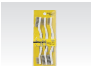
67076 サッ!とる2 すみすみブラシ3本入