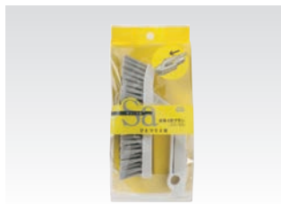
67073 サッ!とる2 合体2役ブラシ