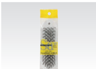
67072 サッ!とる2 パワーブラシ