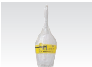
67078 サッ!とる2 エレパワー-M