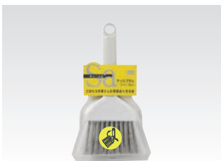
67071 サッ!とる2 サッシブラシ