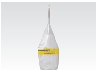
67079 サッ!とる2 エレパワー-L